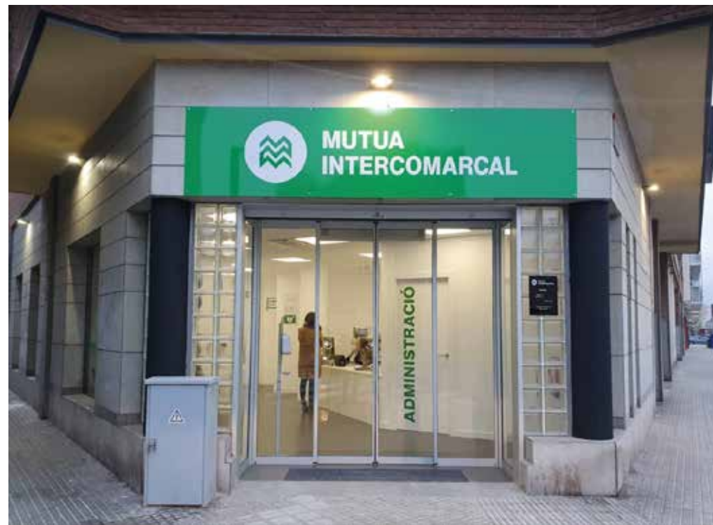
Mollet del Vallès